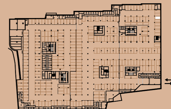
PLANTA PISO ESTACIONAMENTO -2 / PARKING FLOOR -2