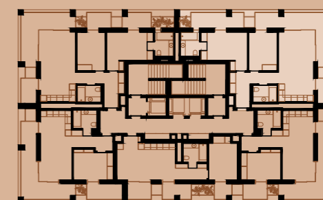
PLANTA PISO 9 | FLOOR PLAN 9

LUGARES DE ESTACIONAMENTO + ARRECADAÇÃO | PARKING UNITS + STORAGE 1+1