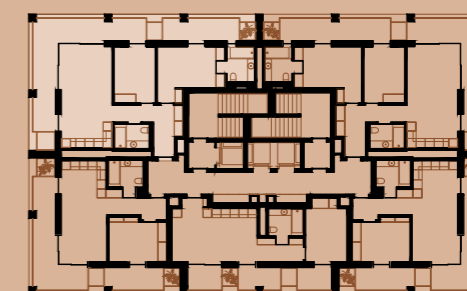
PLANTA PISO 20 | FLOOR PLAN 20

LUGARES DE ESTACIONAMENTO + ARRECADAÇÃO | PARKING UNITS + STORAGE 1+1