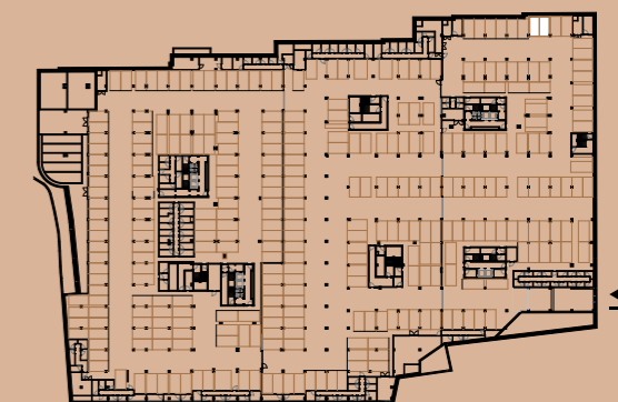
PLANTA PISO ESTACIONAMENTO -2 / PARKING FLOOR -2