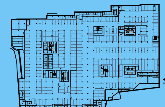
PLANTA PISO ESTACIONAMENTO -2 / PARKING FLOOR -2