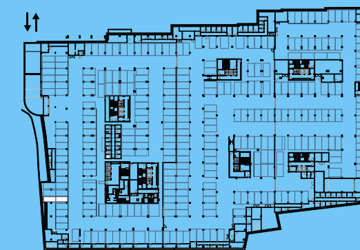
PLANTA PISO ESTACIONAMENTO -1 / PARKING FLOOR -1